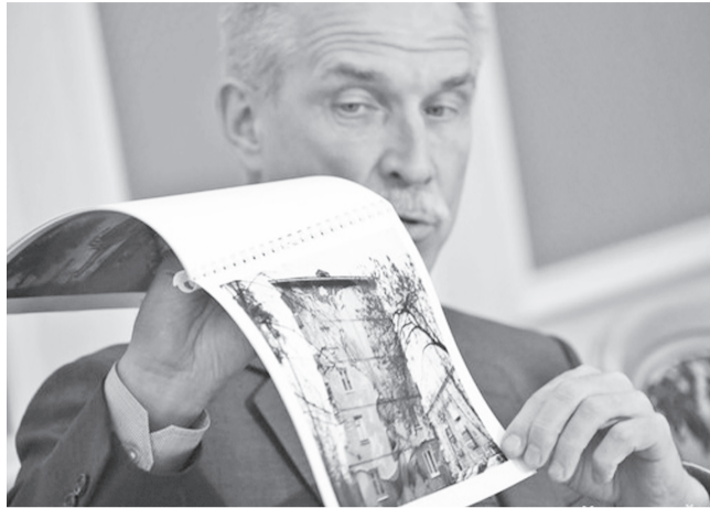
↑ Губернатор Сергей Морозов поддержал идею проведения фестиваля росписи фасадов «Мир цвета» в Ульяновской области. Идея предстоящего события состоит в том, чтобы улучшить внешний облик жилых районов городов области.