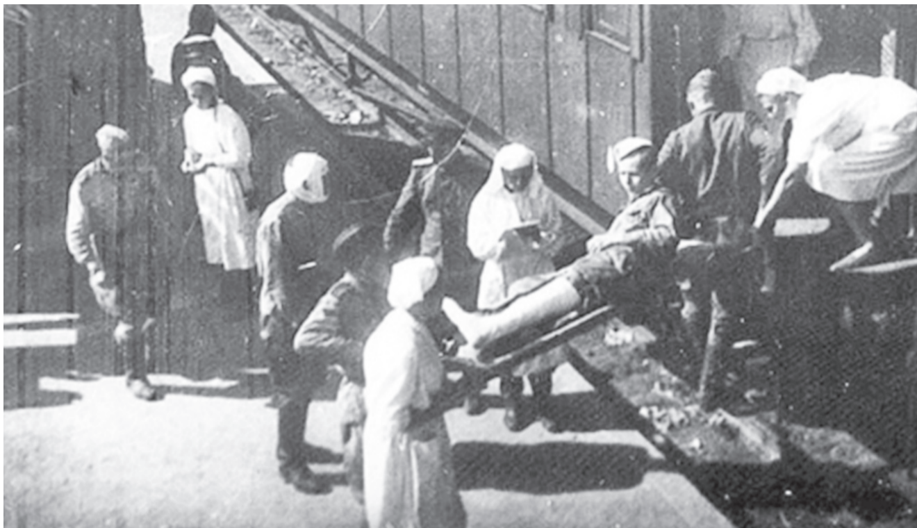
«Летучки» курсировали по железным дорогам и в зимнюю стужу, и в летнюю жару всю войну

7 ноября 1941 года в заповедной столице страны состоялся парад. Парад в тыловом Куйбышеве - один из крупнейших в истории. К 139-му дню войны город на Волге - официально вторая столица страны. Поэтому на