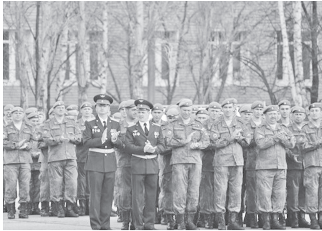
31-я отдельная гвардейская ордена Кутузова II степени десантно-штурмовая бригада отметила 17-летие со дня образования. Глава региона вручил государственные и региональные награды военнослужащим 31 ОДШБр.