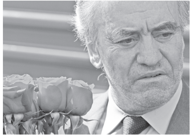
Концерт симфонического оркестра Мариинского театра под управлением Валерия Гергиева в Ульяновске посвятили памяти Майи Плисецкой. В тот же день maestro встретился с первым в России региональным сводным детским тысячным хором.