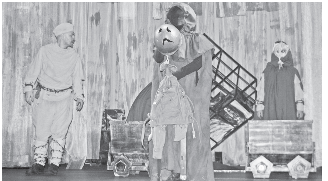
Измученный войной кукольный Теркин - это заплечный мешок-голова, ручки-ножки из четырех солдатских ремней да пробитая каска со злобещим оскалом...

И в процессе работы над премьерой создателям пришлось одержать свою маленькую победу. За два дня до первого представления спектакля сломал ногу и оказался на ко-