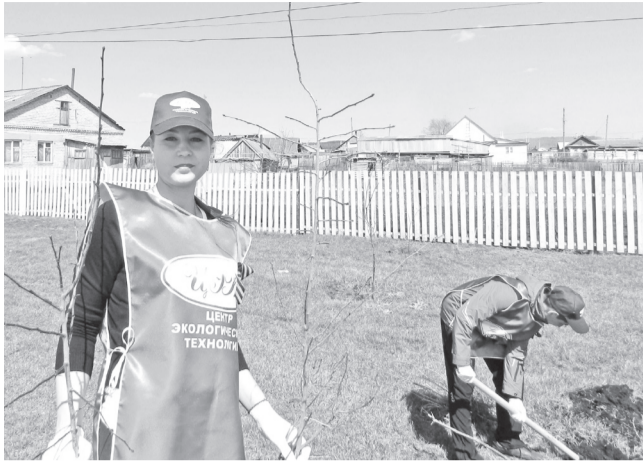
↑ В Засвияжском районе Ульяновска Центрэкотех, школьники, областная Экологическая палата, сотрудники ТОС посадили аллею «Леса Победы».