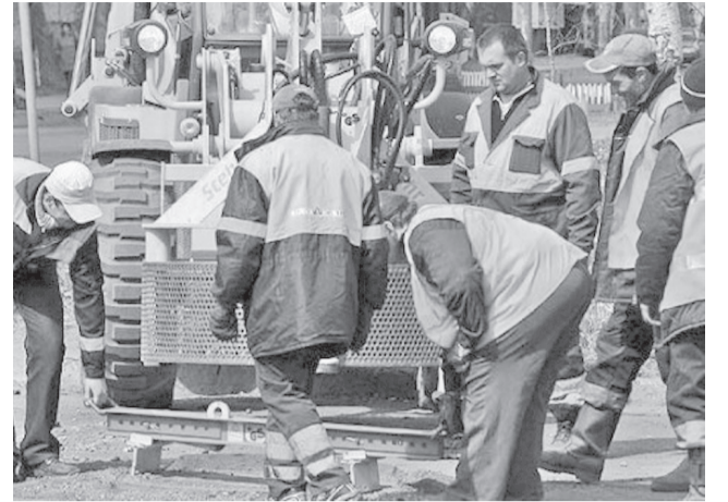
↑ Дорожные работы на центральных улицах Ульяновска планируется завершить к 12 июня. Основные работы по карточному ремонту на магистральных и центральных улицах Ульяновска будут завершены к 9 мая.