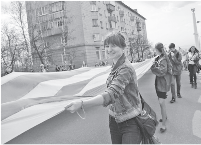
В торжественном митинге в честь Дня солидарности трудящихся приняло участие порядка 15 тысяч ульяновцев. Одна из праздничных колонн была оформлена тематической атрибутикой - георгиевской лентой.